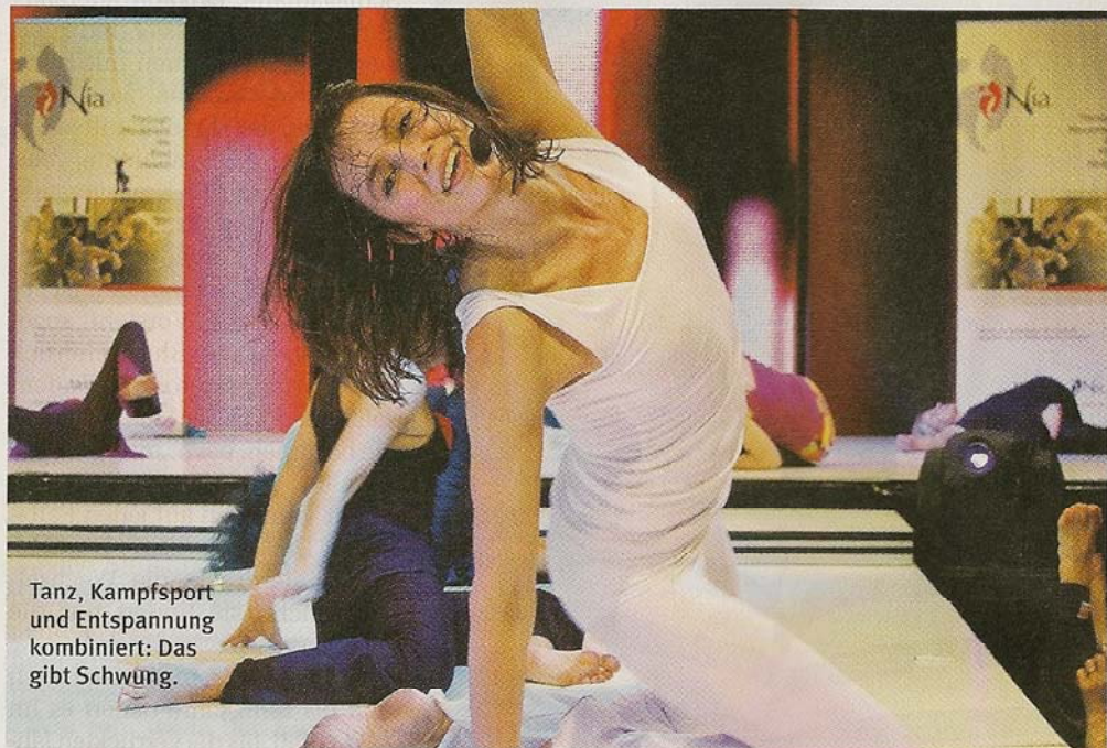
Tanz, Kampfsport und Entspannung kombiniert: Das gibt Schwung.